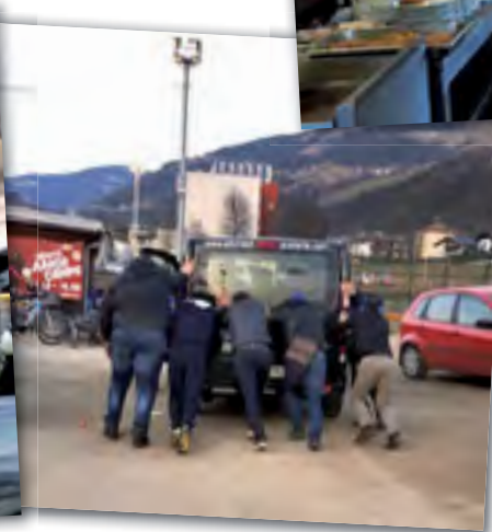
Zur perfekten Organisation gehört auch das Helfen und Abschleppen eines Vereinsbusses (in diesem Fall der nagelneue Vereinsbus der Mannschaft Oberpuschtra Jugend)