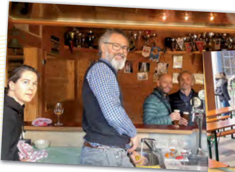
Fleißige Helfer beim Turnier. Ein großer Danke an alle!