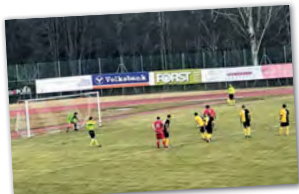
Das 1:0 für Kaltern per Elfmeter