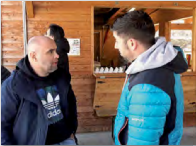
„Turnier-Chef“ und „FC-Südtirol-Chef“ beim Fachsimpeln