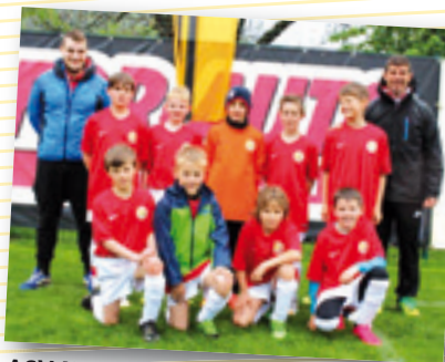
ASV Natz II/Spain