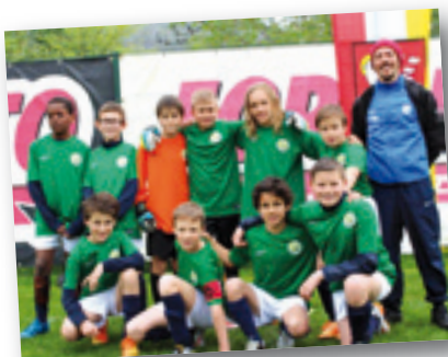
SSV Brixen II/Republic of Ireland