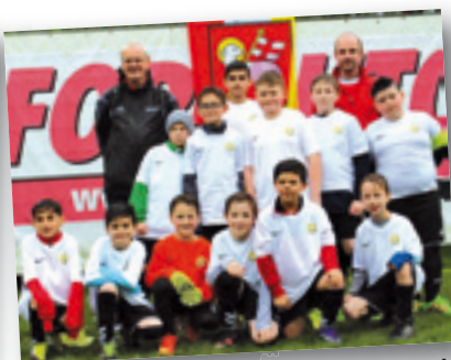
SV Sallern Regensburg (D)/Österreich