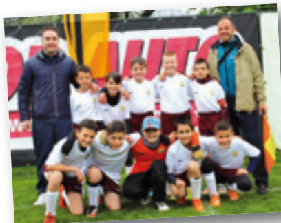
ASD Laives Bronzolo/Poland