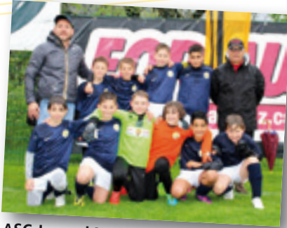
ASC Jugend Neugries/France