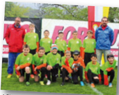
ASV Latzfons/Northern Ireland