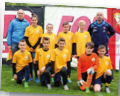
Junior Team Passeiertal/Sweden