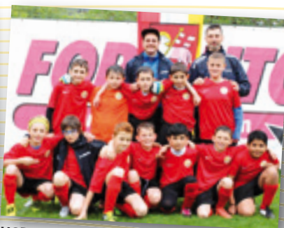
USD Bressanone/Czech Republic