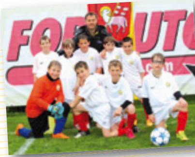
ASV Milland I/Albania