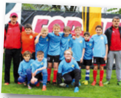
SG Vahrn Neustift/Iceland