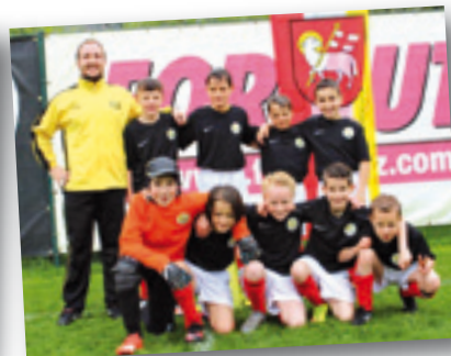
ASV Milland II/Deutschland