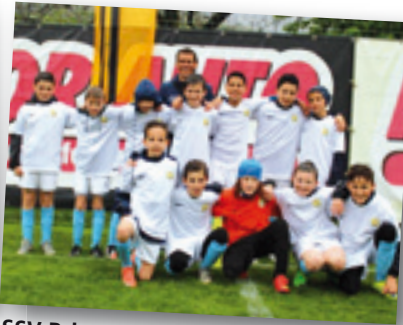
SSV Brixen I/Slovakia