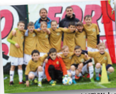
FC Slovan Havlickuv Brod (CZ)/Wales