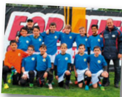
US Bassa Anaunia/Italia