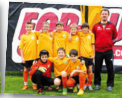
ASV Natz I/Ukraine